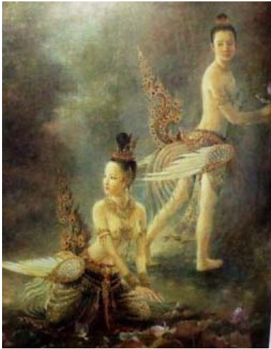
นางมโนราห์