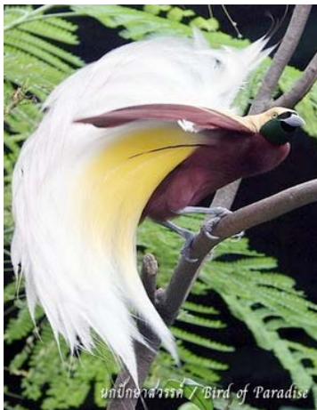
นกการเวก ที่มา :