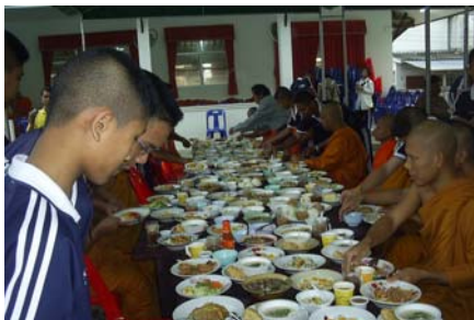
นักเรียนให้ทานไฟในวันเด็ก