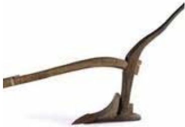
คันไถ : ที่มา http://www.kasetporpeang.com

ยั้งไถยั้งแล้งเหอ ก้มแลหัวหมูก็ซัดใจ แตกแหงเหมือนรอยตีนนก แตกแหงเหมือนรอยตีนนก ก้มแลคันไถก็ซัดดอก ซัดดอกไปทุกสิ่ง ๑