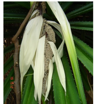
ดอกปาหนัน

ครีון้องเหอ คือต้นลำเจียก น้ำค้างตกเปียก ลำเจียกหอมหวาน ถ้าพี่ชายรักข้า อย่าบวชอยู่ให้ช้านาน ลำเจียกหอมหวาน สงสารดอกลำเจียก ๒