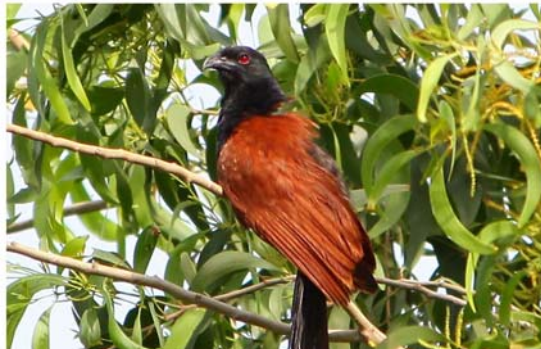
นกกะปูด

ชูดพร้าวเฉียวเฉียว ไม่ให้เรากินมังหว่า น้ำเณรไปเมืองไชยา ท้องดางหางดอก ผูกไว้เรือนใน อ้ายแก้วตาตายพาไป ไปทุ่งนาโยโกหวัน ๑