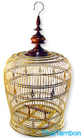
กรงนกเขา