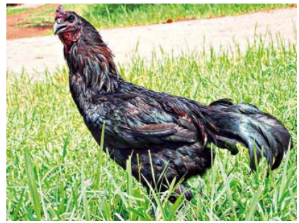
ไก่อดำ

กรกกรก หมายถึง เสียงของไก่, ตีนครก หมายถึง ส่วนของก้นครกที่ติดกับพื้น, ไม่รู้ไอเต็มเหนียง หมายถึง ไม่รู้จักอ้ม, หวันเที่ยง หมายถึง เที่ยงวัน