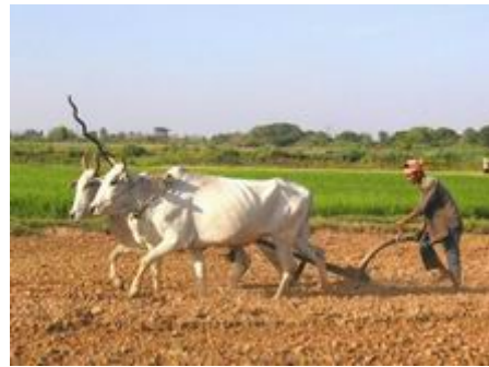
ไถนา : ที่มา http://www.trekkingthai.com