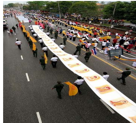
ประเพณีแห่ผ้าขึ้นห่มองค์พระบรมธาตุ

ฝนตกเหอ ฝนตกดังฉา ไปเอาตะกร้า มารับน้ำฝน ตอใดจะเต็ม ตอใดจะล้น ตะกร้ารับน้ำฝน ตกแล้วก็พันไป