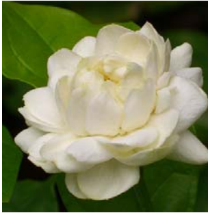
ดอกมะลิ