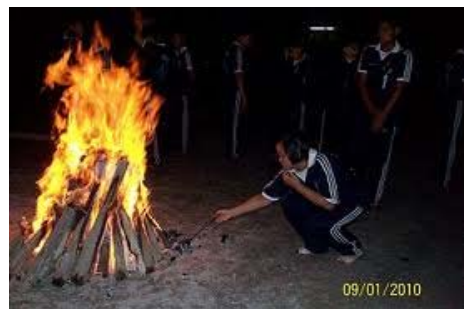
ที่วัดหน้าวัดพระธาตุ