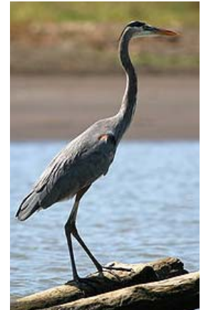
นกขากรไทร

นางนกเหอ นางนกขาไทร อยู่แต่แรกแต่ไทร นางนกขาไทรไม่หอนร้อง ตั้งแต่พี่พลัดพรากไปจากน้อง นกเหอมันร้องนำสงสาร ตัวผู้บินไปเสียว ยังแต่ตัวเหมียวร้องเป็นบางบาน นกเหอมันร้องนำสงสาร ทำให้พี่รำคาญใจ