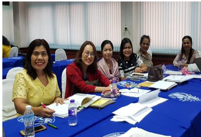
วางแผน และแบ่งกลุ่ม PLC