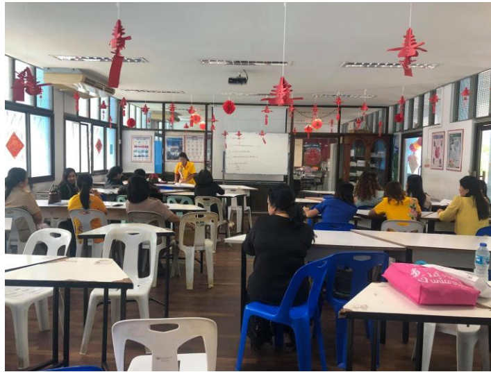
ประชุมกลุ่มสาระ ชี้แจงขั้นตอนการทำ PLC